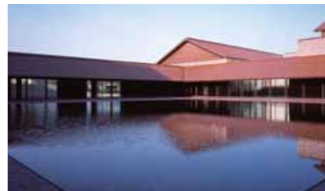
島根県芸術文化センター「グラントワ」