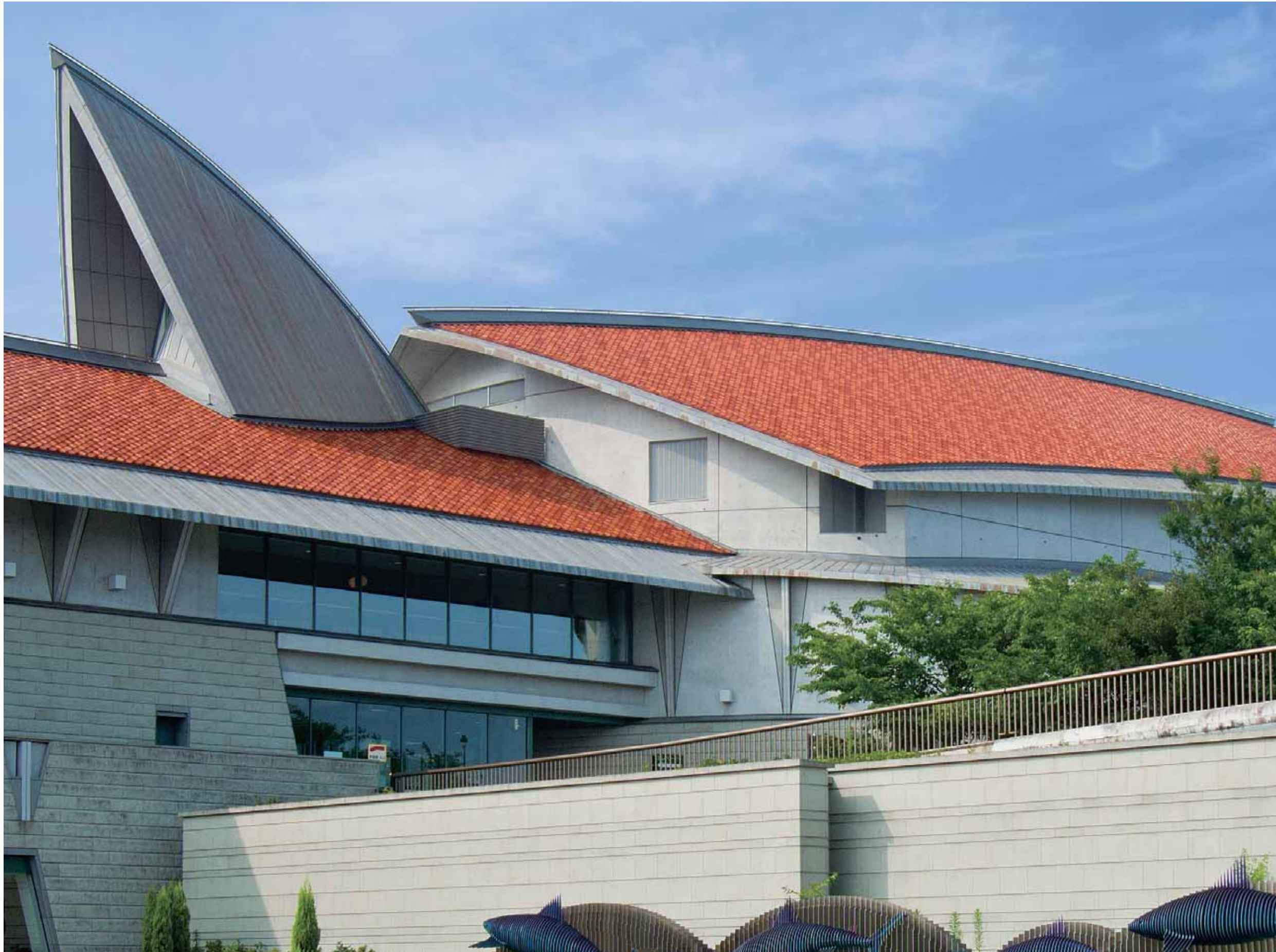
しまね海洋館 アクアス

瓦が建築物に使われ始めたのは紀元前といいます。石州瓦の歴史は約400年、江戸時代の初期に誕生しました。それから今日までの間、瓦の基本性能はほとんど変わっていません。言い換えれば、住宅様式は変わっても、瓦、そして石州瓦は今もこれからも変わる必要のない、ほぼ完成に近い建材であると考えます。私たちはその、先人がつくりあげた逸品の歴史を未来へ伝えようとしています。今の私たちができることは、優れた機能性をより磨き、より確かな高性能にするための弛まぬ努力だと思います。先人に恥じない品質を守るため、今日も瓦づくりに魂を込めます。