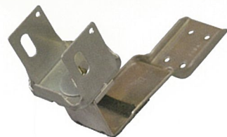
ソーラーパネル用支持金具

J形瓦屋根に太陽光パネルを設置するとき、瓦のズレによる雨漏りや破損を防止するために「シジカ」をお使いください。